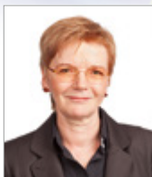
Gabi Zimmer Vorsitzende der der GUE/NGL Fraktion

DIE LINKE. im Europaparlament www.dielinke-europa.eu